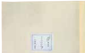
5-410 料紙こまち半懐紙 ¥2,500 (50枚P入) 1入 25×36.5cm 504104 ※1枚につき 5-400 ¥50 504005