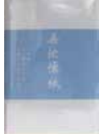
3-155 無地懐紙(25枚) ¥200 食品用クレープ和紙 10入 12.5×18cm 301550