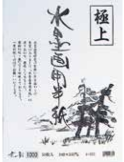
4-331 水墨用半紙(50枚入) ¥1,000 10入 403315