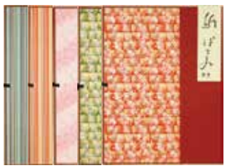
5-101 友禅半紙ばさみ ¥2,200 柄込 5入 37×56cm 501011