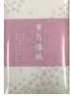
3-154 華の懐紙(20枚) ¥200 食品用クレープ和紙 10入 13.5×18cm 301543