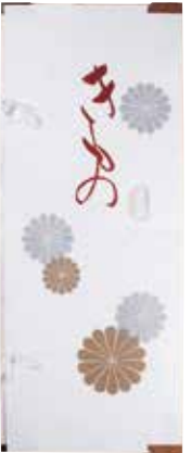
5-600 きもの文庫紙 (雲竜紙・中紙付) ¥500 10枚入 36×87cm 506009