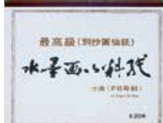
5-303 F6 水墨画料紙 ¥2,000 20枚綴 5入 32×41cm 503039