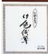
5-301 色紙判水墨画料紙 ¥2,000 50枚綴 5入 24×27cm 503015