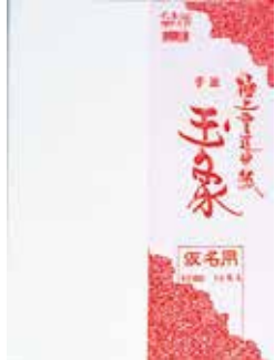
4-332 手漉仮名用半紙(10枚入) ¥500 10入 403322