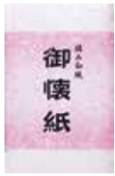
3-152 手揉み懐紙(20枚) ¥300 10入 15×17.5cm 301529