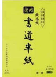
4-335 徳用書道半紙(100枚入) オープン価格 24×33.3cm 60入 403353