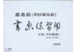
5-306 練習用F6画仙紙 ¥50 (1枚につき) 50入 31.8×41cm 503060