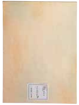
5-411 料紙こまち全懐紙 ¥2,500 (25枚P入) 1入 36.5×50cm 504111 ※1枚につき 5-401 ¥100 504012