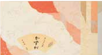
5-412 料紙かすが半懐紙 ¥2,500 (10枚P入) 1入 25×36.5cm 504128 ※1枚につき 5-402 ¥250 504029