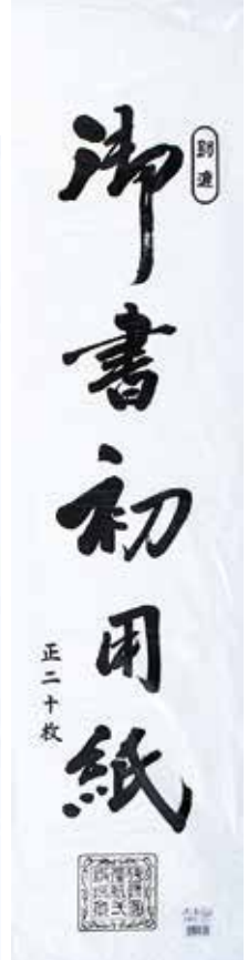
4-329 三枚判書初用紙 (20枚P入) ¥400 50入 24×100cm 34.1g/m 2 403292