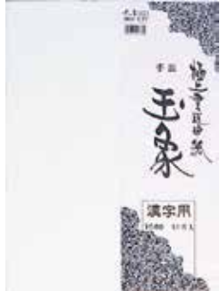
4-333 手漉漢字用半紙(10枚入) ¥500 10入 403339