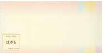
5-416 金振ぼかし半懐紙 ¥5,000 (50枚P入) 1入 (5色各10枚) 25×36.5cm 504166 ※1枚につき 5-406 ¥100 504067