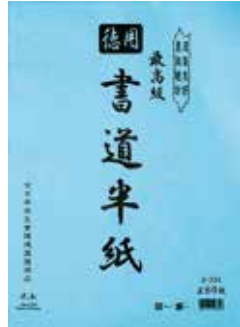
4-334 徳用書道半紙(80枚入) オープン価格 24×33.3cm 80入 403346