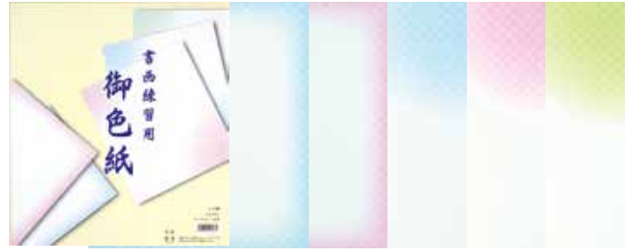
1-176 練習用七宝ぼかし大色紙 ¥300 10枚(5色各2枚)10入 101761