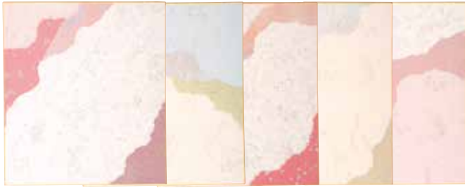
1-122 切継 ¥600 柄込 50入 101228