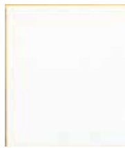
1-400 50入 画仙小色紙 ¥100 104007