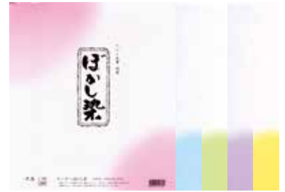
1-189 コーナーぼかし染 ¥400 10枚(5色各2枚)10入 101891