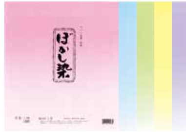
1-188 総ぼかし染 ¥400 10枚(5色各2枚)10入 101884