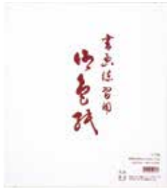
1-174 練習用カラー砂子入 ¥300 10枚(5色各2枚)50入 101747