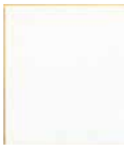
1-402 50入 奉書小色紙 ¥100 104021