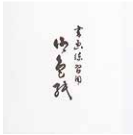
1-175 練習用 白 ¥250 10枚(画仙紙)50入 101754