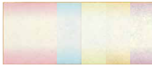
1-401 金振ボカシ小色紙 ¥200 単色・色込50入 104014